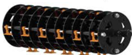
Forestal rotor wood flanged