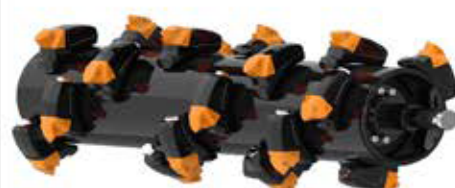
Forestal rotor fixed teeth